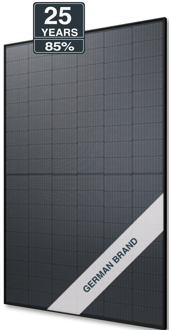
Abb. ähnlich 108MHDE220801A